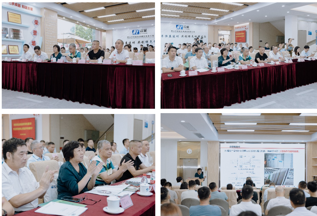
蒸压加气混凝土板应用技术交流会会场

开始向建筑设计端延伸，引导装配式建筑设计向加气板材转向，将业务延伸到板材设计、安装的服务全过程，以适应需求端的变化，同时可以有效地控制施工环节的质量，引领行业走向高质量发展。总之，智能建造与新型建筑工业化的发展已经势不可挡，我们要抓住机遇，取得更好的发展。